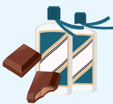
「茅小凌酒心朱古力」

贵州茅台紧接于9月14日宣布与朱古力品牌Dove合作推出「茅小凌酒心朱古力」，并于9月16日正式发售，大批市民于茅台冰淇淋门市排队抢购，产品更于网购平台天猫参与同步首发的三间商户上架开售一分钟内售罄。